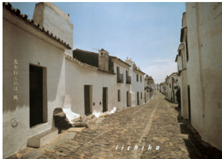
1996年10月(後期展示予定)