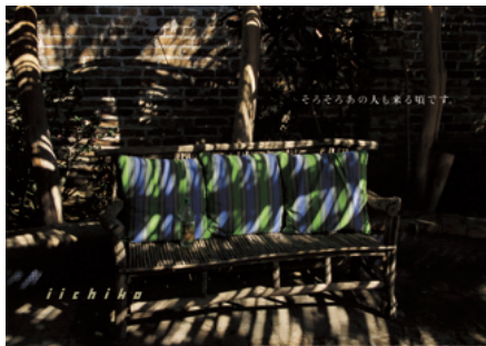
2018年6月(後期展示予定)

みずみずしい風景の中にぽつんと置かれた1本のボトル、短くも心に響く詩の一節のような言葉。駅の構内で、横長の大きなポスターに目を奪われた経験はないでしょうか。控え目に入れられた商品名から、ようやくそれがある酒の広告であることがわかります。その名は「いいちこ」。大分県宇佐市の酒造メーカー、三和酒類株式会社が1979年から発売するロングセラー商品です。